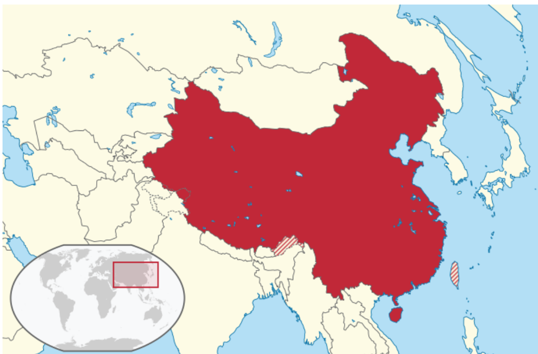
Carte de la Chine dans l'Est de l'Asie.