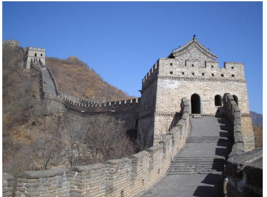
Partie de la Grande Muraille

Cette « grande muraille » est un ensemble de fortifications militaires chinoises construites en plusieurs étapes et à plusieurs endroits. Elle fait partie du Patrimoine mondial de l'UNESCO depuis 1987.