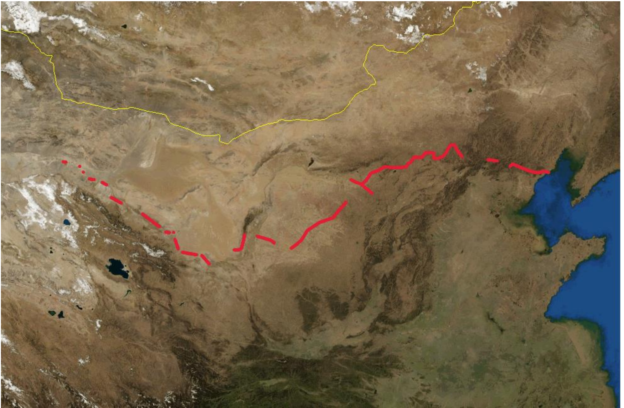
Vue satellite de la Chine avec la Grande Muraille marquée en rouge.