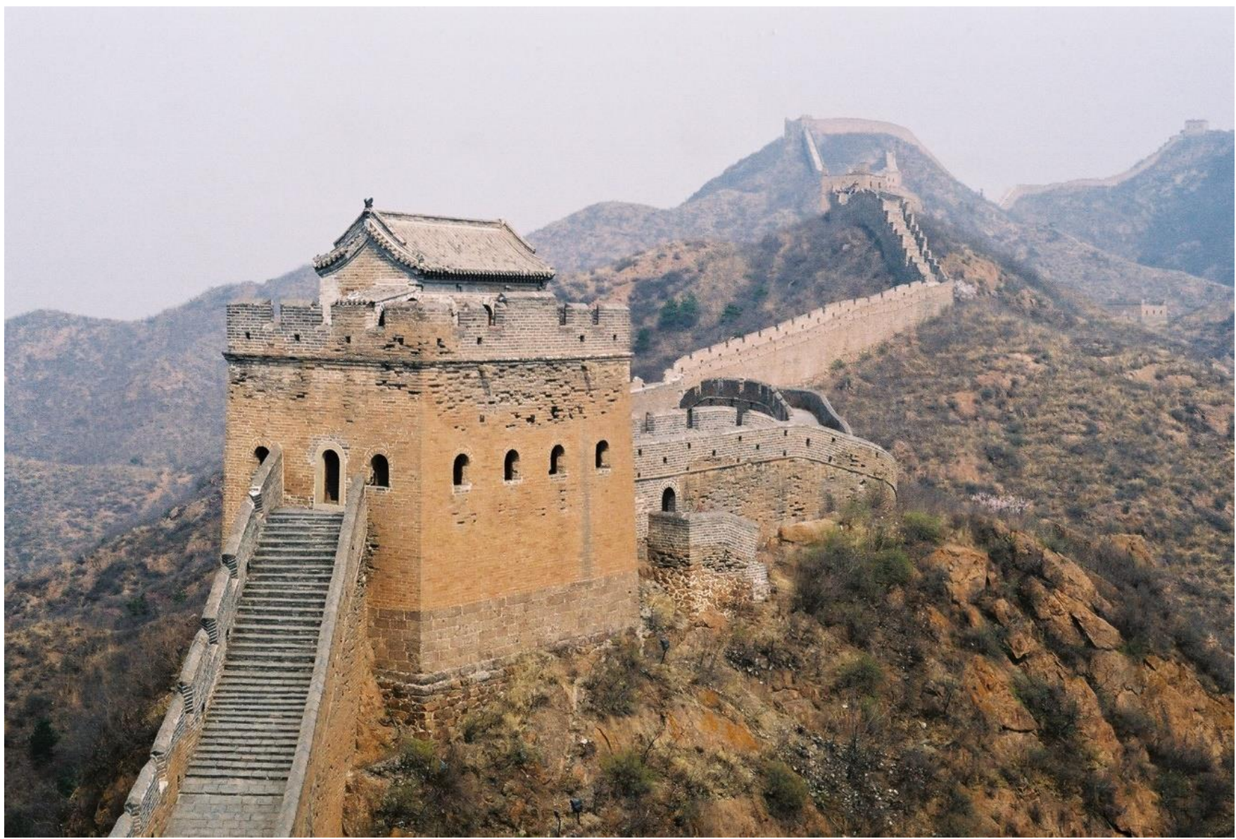
Vue d'un fragment de la Grande Muraille.