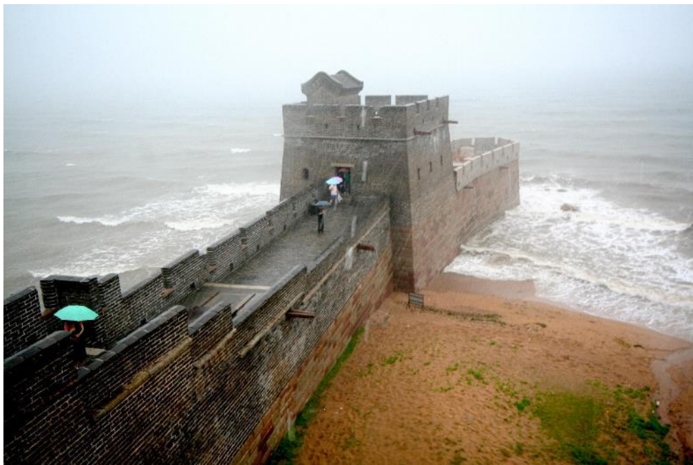
Extrémité de la Grande Muraille rejoignant la mer de Bohai.

C'est la partie construite par la Dynastie Ming (entre 1368 et 1644) qui est la plus connue et appelé « Grande Muraille ».