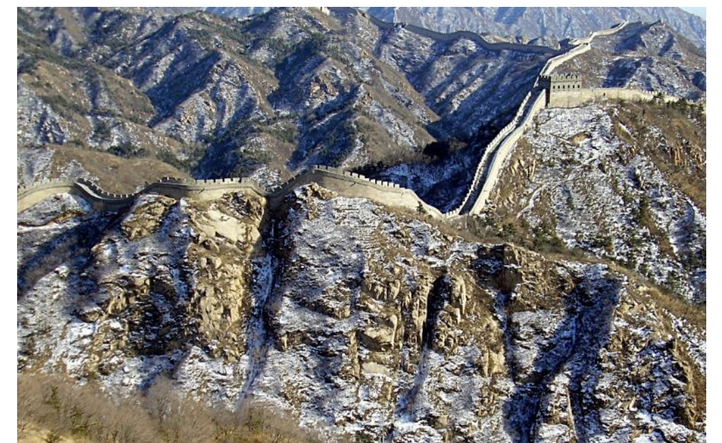
Vue enneigée de la Grande Muraille

Cette muraille protégeait la Chine des pays du Nord.