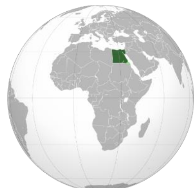
Carte de l'Égypte dans le monde