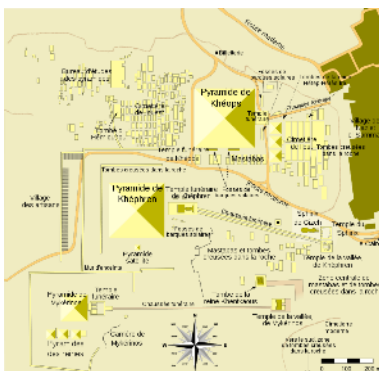
Carte du site de Gizeh