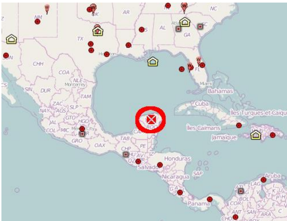
Carte du Mexique avec localisation de Chichen Itza