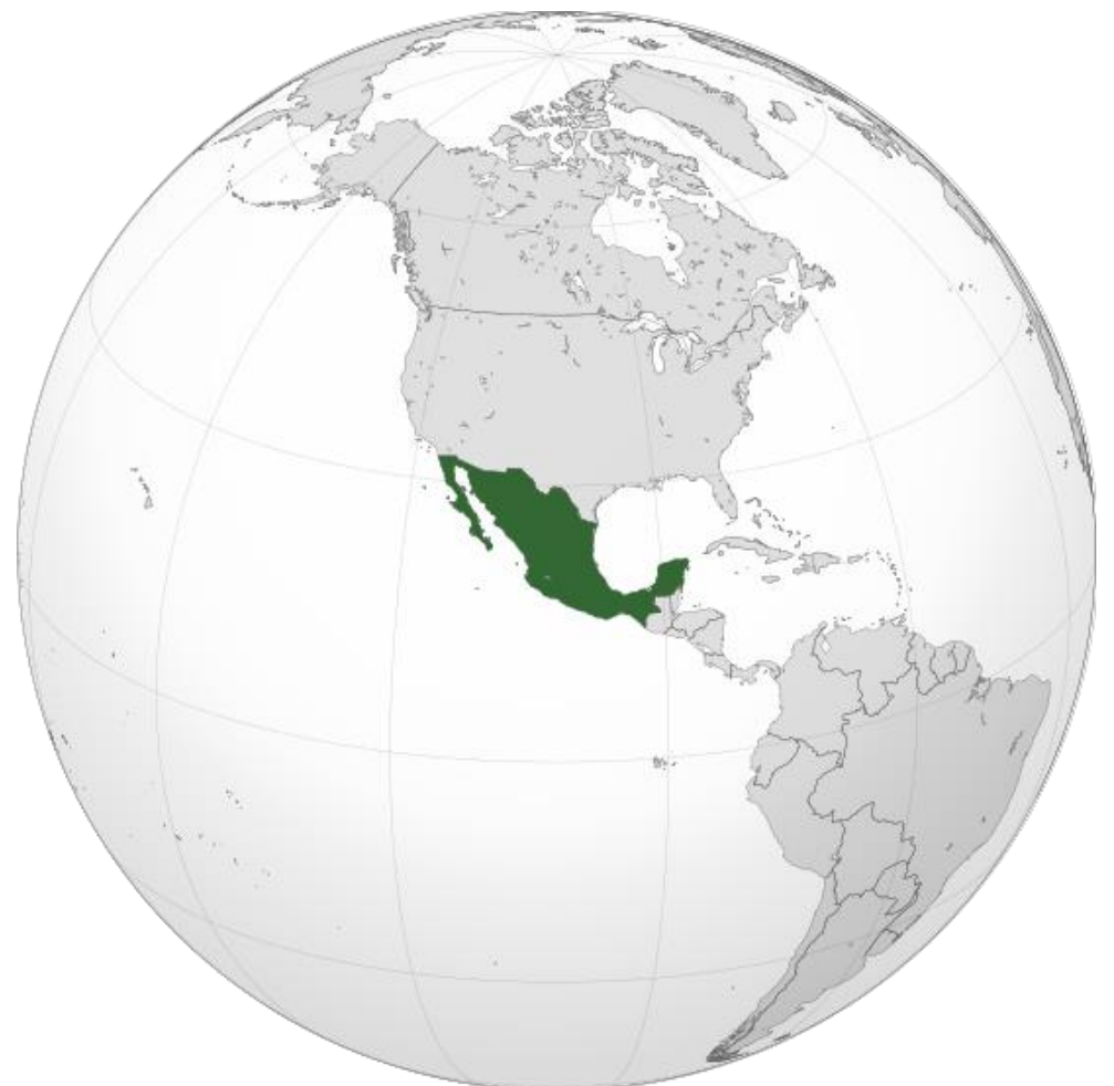
Carte du Mexique dans le monde