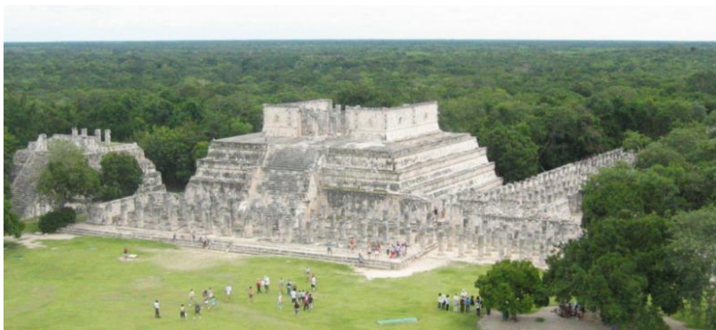
Temple des guerriers jaguars