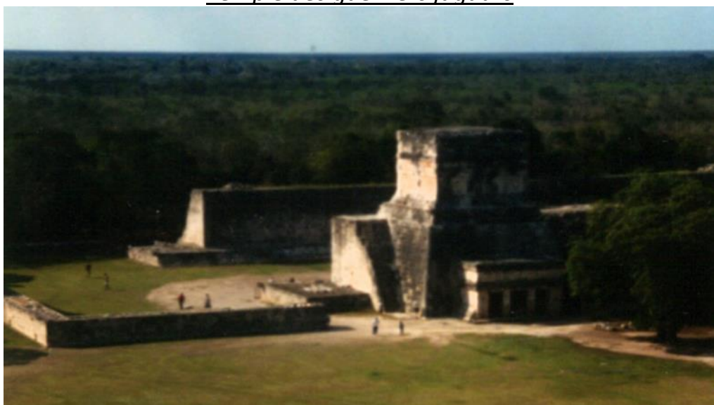
Terrain du « jeu de balle ».

Dans les années 1500, les espagnoles se sont servi de ce site comme d'une capitale puis l'ont abandonné.