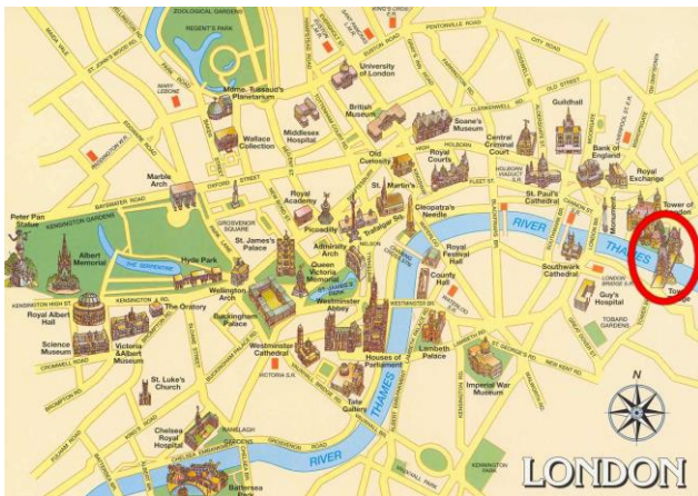
Carte de Londres présentant les principaux monuments.