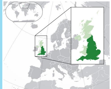
Carte d'Angleterre dans le monde