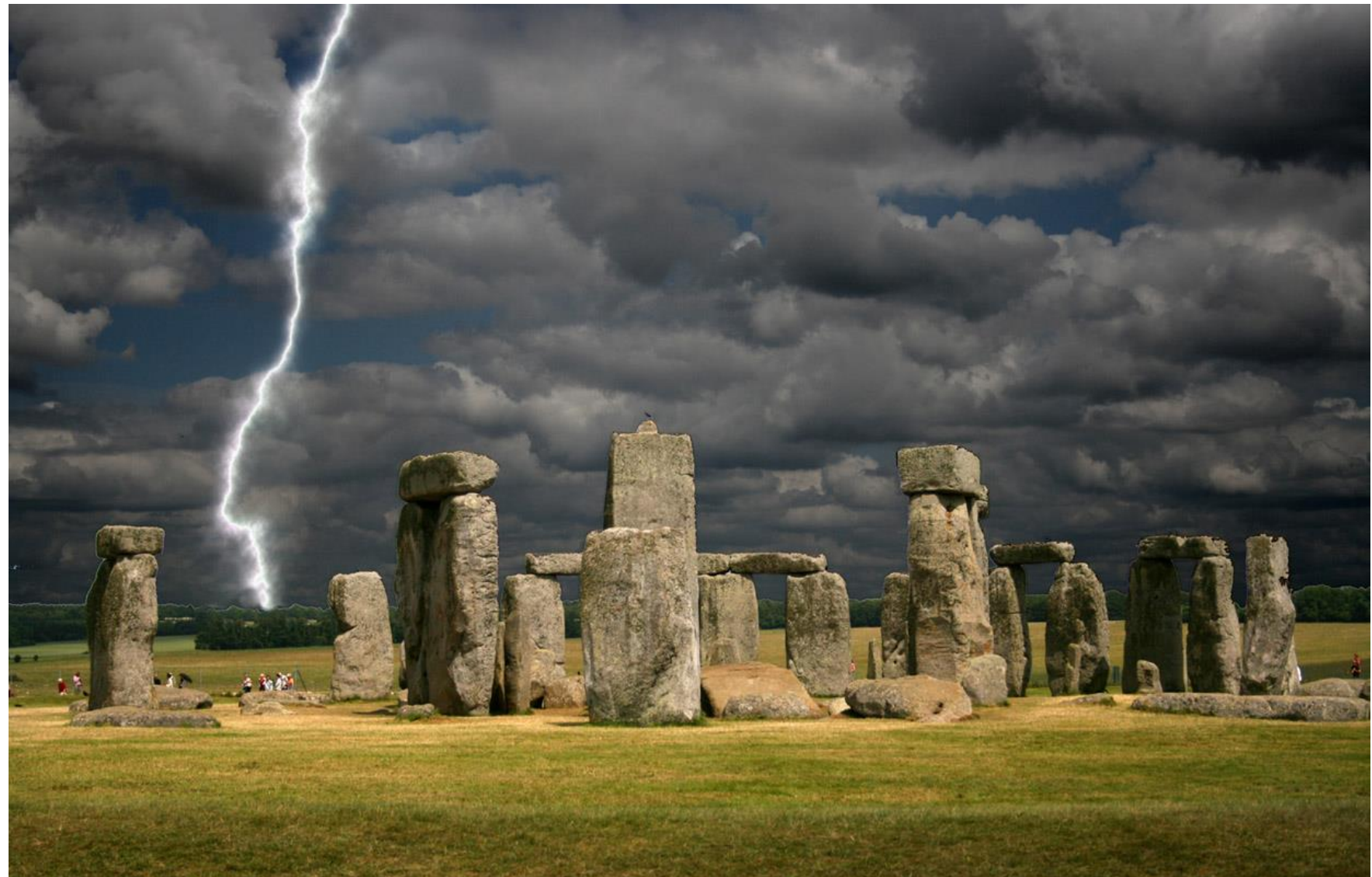
Photo de Stonehenge un jour d'orage avec éclair capturé.

Le site de Stonehenge a été étudié en détails, à partir de 1901. De nombreuses fouilles ont eu lieu et on a maintenant, une idée de ce qui a pu être l'histoire de ces vestiges.