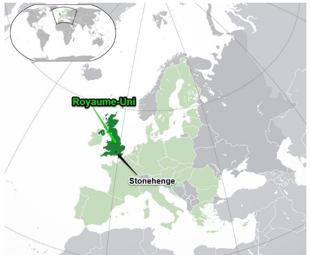
Carte du Royaume-Uni en Europe.