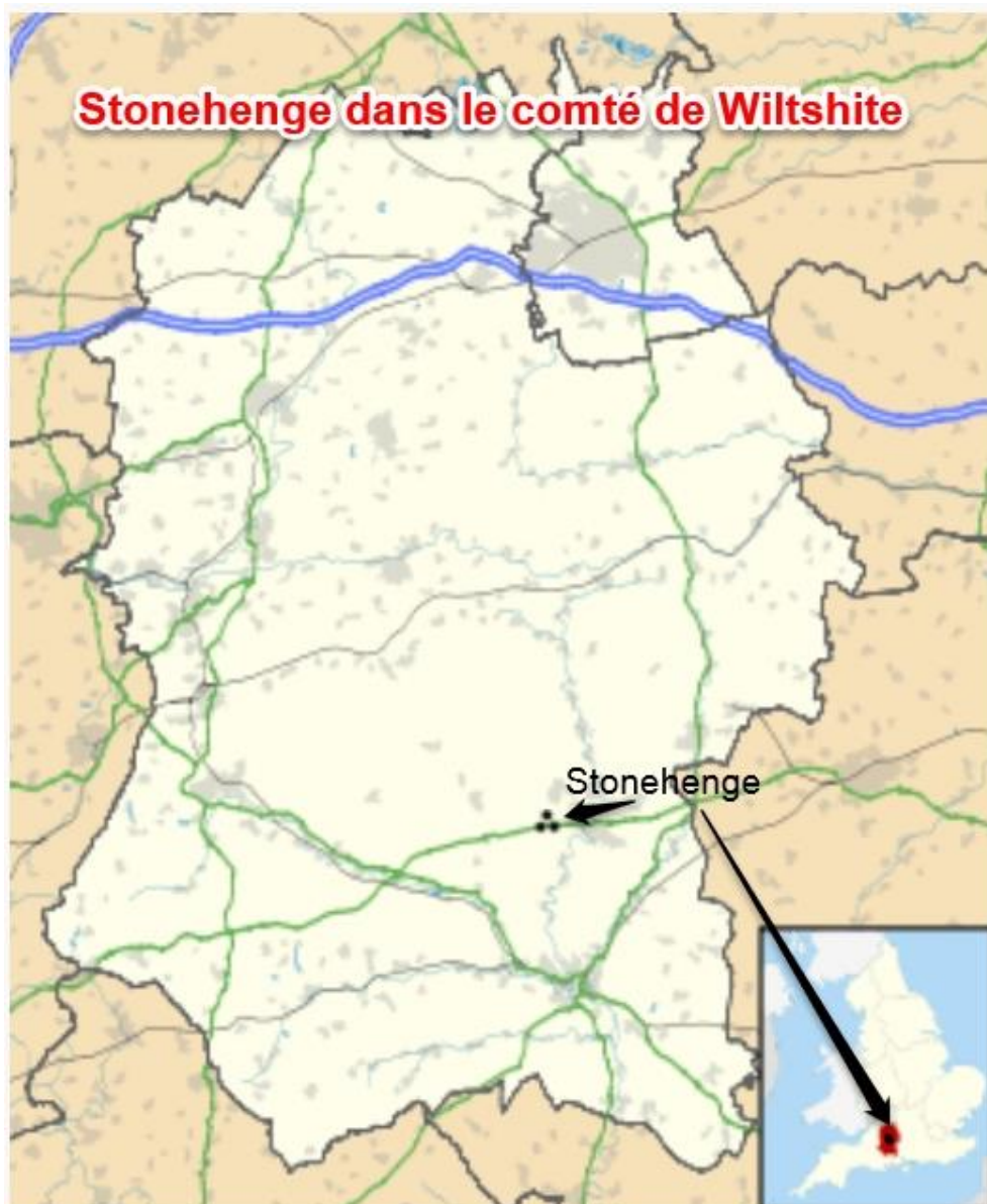
Carte du Wiltshire et Stonehenge.