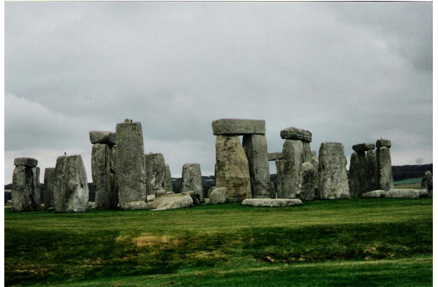
Au premier plan : l'enceinte circulaire avec fossé et talus intérieur.

On pense qu'il a été occupé dès 8000 avant JC. Il reste des traces de poteaux qui datent de cette époque !