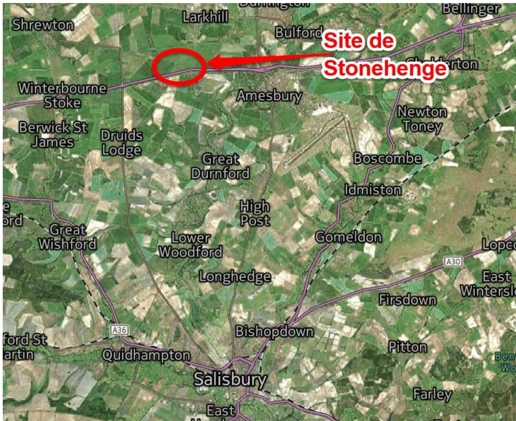
Carte présentant la position de Stonehenge.