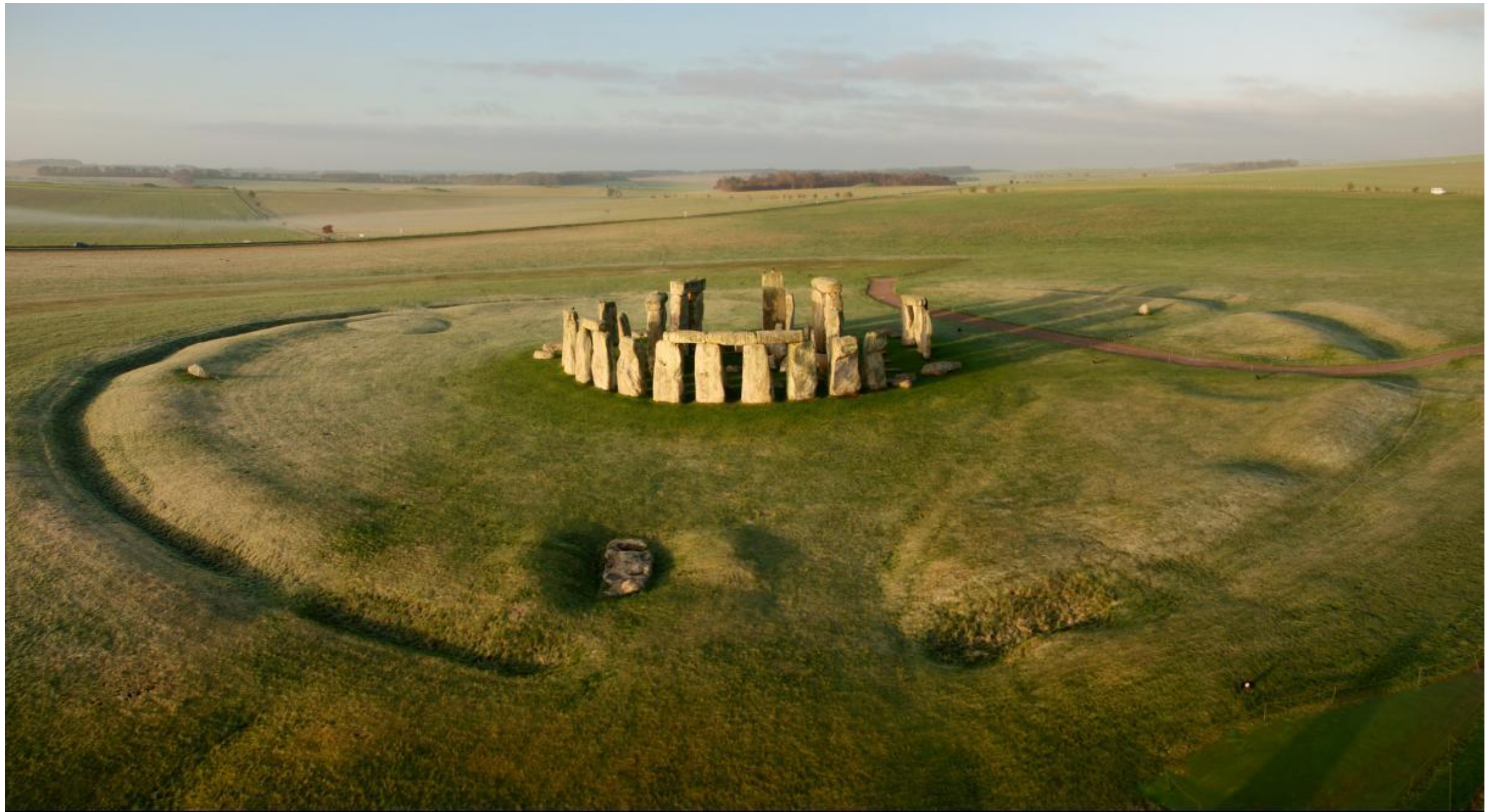
Photo en vue aérienne du site de Stonehenge.